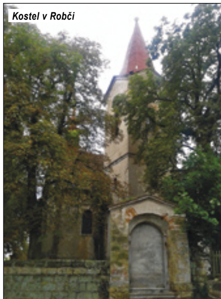
Kostel v Robčí