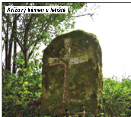
Křížový kámen u letiště

Ve vlhkém podzimním počasí je příjemnější vynechat lesní a polní cesty a spolehnout se především na silnice. Na přibližně 35kilometrovou vyjížďku se vydáme z Dubé směrem na Pavličky.