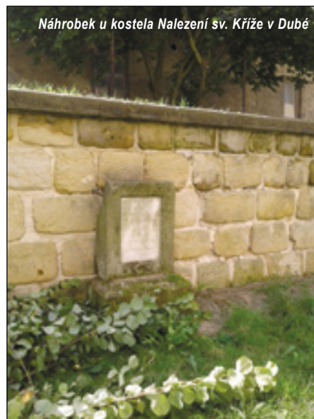
Náhrobek u kostela Nalezení sv. Kříže v Dubé