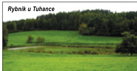
Rybník u Tuhance