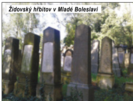
Židovský hřbitov v Mladé Boleslavi

Památkově chráněný areál židovského hřbitova se rozkládá na stráni nad Pražskou ulicí, ze které je hlavní vstup. Hřbitov je doložen již v roce 1584, od té doby byl několikrát rozšířen, pohřbívalo se zde až do 60. let 20. století. Na hřbitově se nachází na 2 000 renesančních, barokních a klasicistních náhrobků. V opravené osmiboké obřadní síni z roku 1889 je instalována expozice o historii židovského