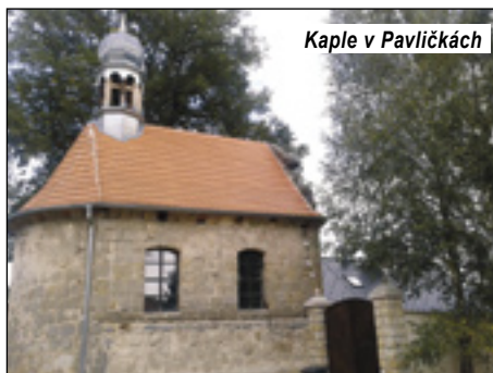
Kaple v Pavličkách

Sjedeme zpět na silnici a pokračujeme smě-