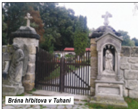
Brána hřbitova v Tuhaní

Ekofarma a soukromí majitelé ho plánují opravit. Ekofarma sídlí v památkově chráněném objektu bývalé fary, který sousedí s kostelem. Naproti ko-