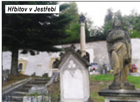
Hřbitov v Jestřebí

Pod hradní zříceninou se v Jestřebí se nachází památkově chráněný hřbitov se zvonící. Původ věže není zcela jasný, bývá považována za pozůstatek staršího, požárem zničeného kostela,