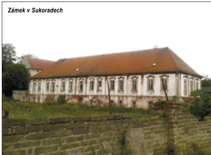
Zámek v Sukoradech