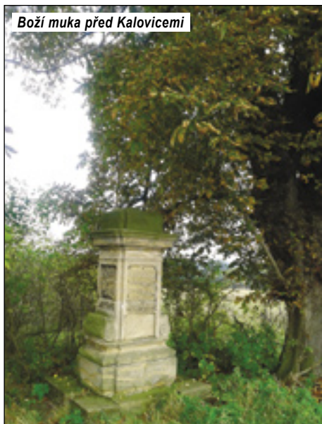
Boží muka před Kalovicemi