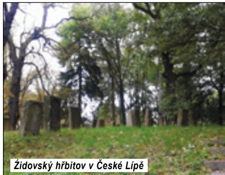
Židovský hřbitov v České Lípě

Starý židovský hřbitov se nachází mezi ulicemi U Střelnice a Roháče z Dubé. Traduje se, že byl založen v roce 1479, každopádně nejstarší dochované náhrobky pocházejí ze 17. století. Hřbitov byl rozšířen v roce 1758 a byl používán do roku 1905. Toho roku byl zřízen nový