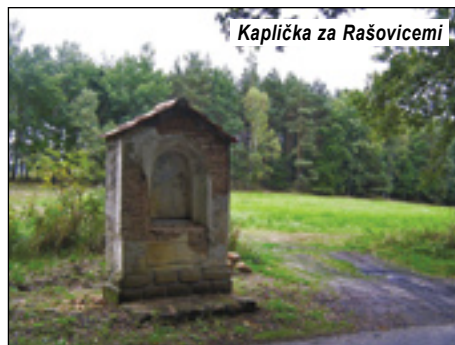
Kaplička za Rašovicemi