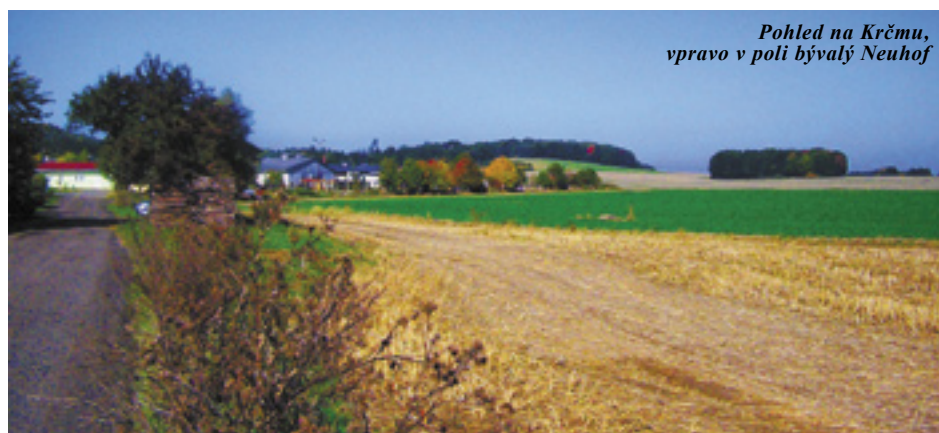
Pohled na Krčmu, vpravo v poli bývalý Neuhoř