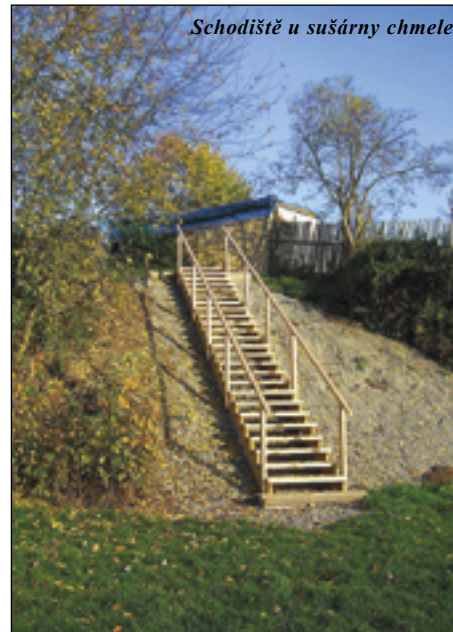
Schodiště u sušárny chmele

sv. Prokopa (i tato část bude obnovena) a dále k Šibeničnímu – či Švihovskému mlýnu. A druhá větev cesty vedla k Vrabcovskému mlýnu a dále do Deštné. V polích je tato cesta rozoraná, ale v lese se cesta dochovala, ačkoliv místy je vyježděná nad původním úvozem. V dolní části ji tvoří hluboce zasekaný zářez do skály, který ústí nedaleko Vrabcovského mlýna.