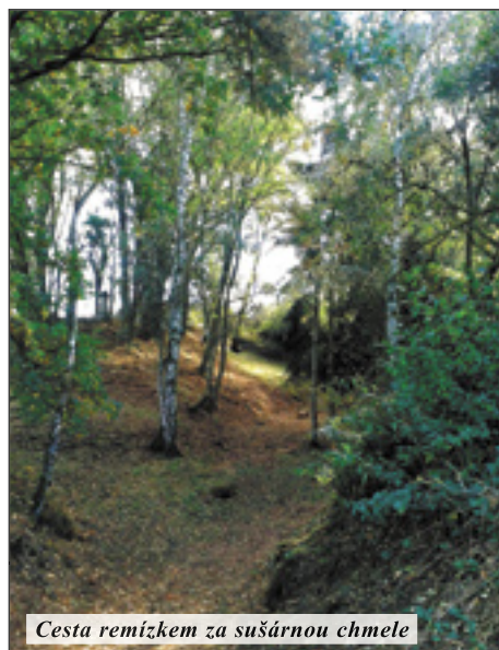
Cesta remízkem za sušárnou chmele