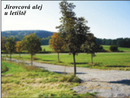
Jírovcová alej u letiště

Na podzimní procházku, dlouhou necelých 10 kilometrů, se vydáme po modré turistické značce po silnici na Pavličky. Pár kroků před vjezdem na bývalé letiště mineme křížový kámen, půjdeme dále po silnici a přibližně po 300 metrech odbočuje doleva cesta s alejí mladých jírovců. Podíváme-li se doprava, vidíme přes pole Krčmu, od ní vedla původně k silnici cesta. Alej jírovců je její obnovené