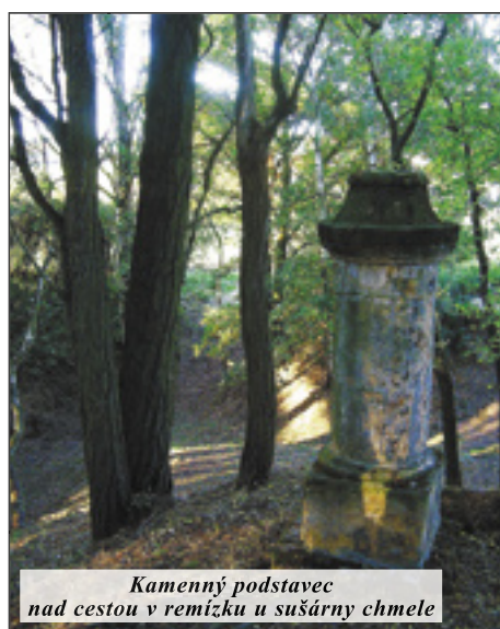
Kamenný podstavec nad cestou v remízku u sušárny chmele