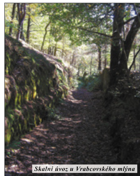
Skalní úvoz u Vrabcovského mlýna