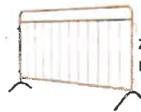
zábrany v zeleni mimo komunikaci