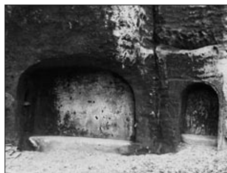
Výklenky pod Božím hrobem

Stezka dále vede vpravo a pak vlevo strmě nahoru. Na náhorní planině porostlé borůvkám pokračujeme pěšinou na východ nad Kopřivovým dolem. Pěšina se posléze mění v cestu a o něco dále se napojí na lesní úvoz. Pokračujeme vpravo až k rozcestí u zajímavě rostlého buku, kde opět půjdeme vpravo klesajícím terénem. Z úvozu se stává hluboký zářez do pískovcové skály.