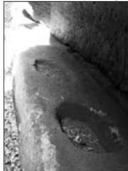
Žlaby ve Studeném dole

se zde mění v sotva znatelnou pěšinu, která je na několika místech doslova zavalena padlými kmeny. V letním období průchodu brání navíc nejen kopřivy, ale občas i mnohem nebezpečnější bolševník. Tato statná rostlina může při dotyku za slunečního světla způsobit hluboké, špatně se ho jící popáleniny. Z levé strany se tyčí zvrásněné rozeklané skalní bloky, lemující celé údolí, v jednom místě jsou pod převisem vysekány žlaby pro dobytek, který zde údajně obyvatelé Žlaby ve Studeném dole schovávali v době nepokojů.