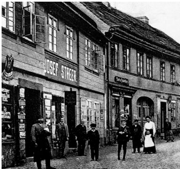
Pouliční život v Poštovní, dříve Josefské ulici roku 1927